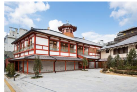
道後温泉別館 飛鳥乃湯泉

★ 協和酒造株式会社 酒蔵カフェはつゆき イートドリンク50円引き サイクルオアシス