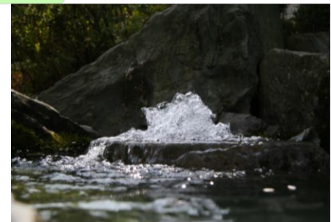
西条の名水「うちぬき」